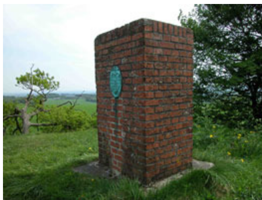
Illustr.4 Det geodætiske postament på toppen af højen er et af Danmarks hovedopmålingspunkter.