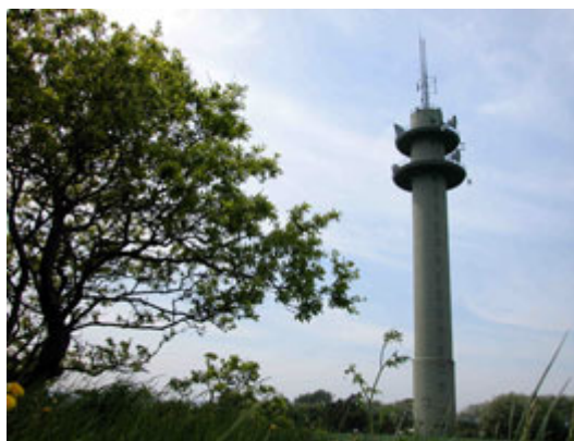
Illustr.2 Det store teletårn vest for højen ses på mange kilometers afstand.