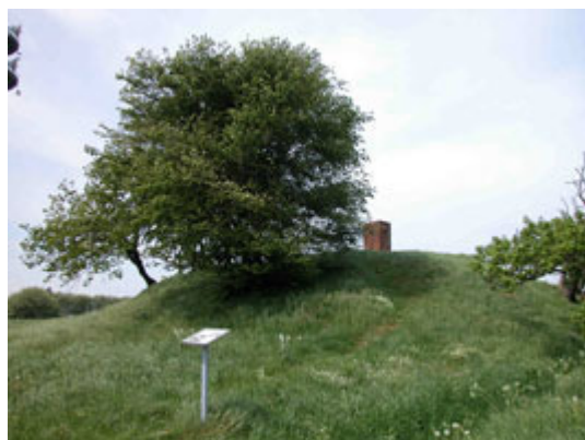
Illustr.3 Højen er sikkert mellem 3.800 og 3.000 år gammel. Her set fra sydøst.