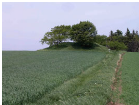
Illustr.1 Trampestien som fra den syd liggende P-niche leder frem til højen.